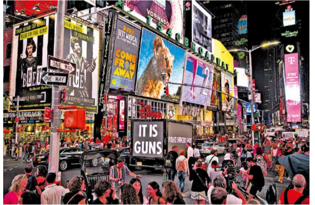
It Is Guns, 2019 © 2019 Jenny Holzer, member Artists Rights Society (ARS), NY

Im K21 der NRW-Kunst-sammlung wird es hingegen